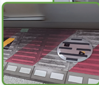
◀ 落合駅_工事が始まっています