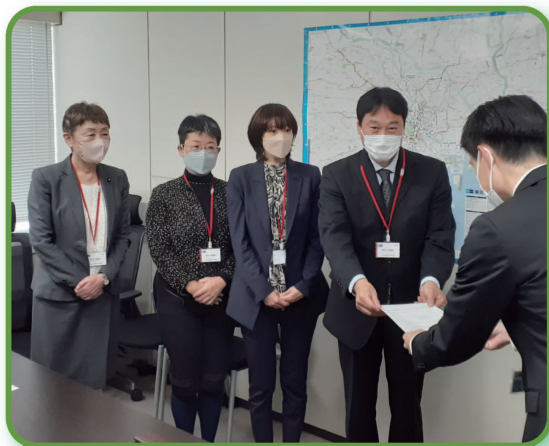
▲ 東京メトロ本社へ申入れ