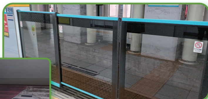
▲ 同タイプのホームドアが設置される予定